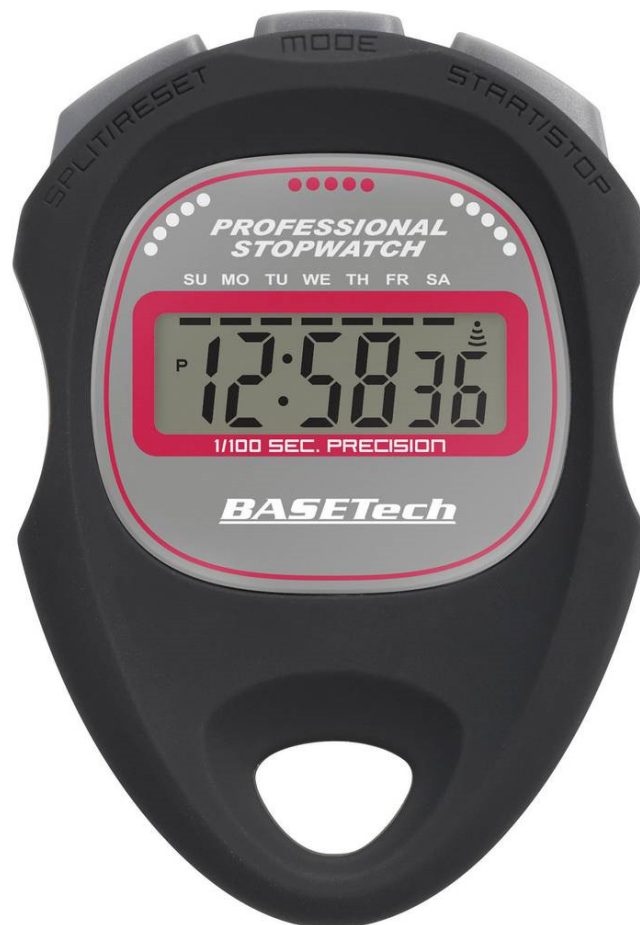
Figuur 1: Basetech WT-034 stopwatch. Aan de bovenzijde bevinden zich 3 knoppen. Van links naar rechts: SPLIT/RESET, MODE en START/STOP.