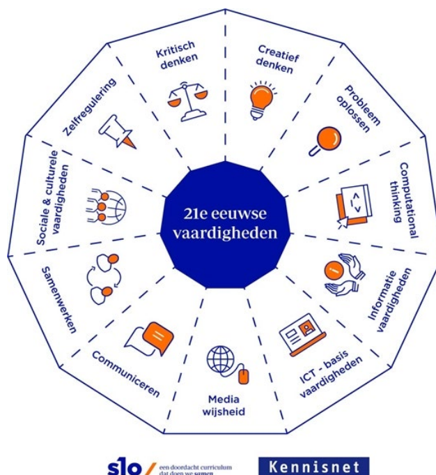
Figuur 1: Overzicht vaardigheden voor de 21e eeuw. SLO/Kennisnet 2014.