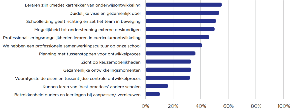
Figuur 3: Percentage respondenten dat aan geeft dat de voorgelegde helpende factor goed aanwezig is op hun school.

Aan de respondenten is gevraagd of ze tegen een aantal voorgelegde knelpunten aanlopen als ze het onderwijsprogramma op hun school willen aanpassen. Ongeveer de helft van hen gaf aan dat ze in sterke mate aanlopen tegen het gebrek aan (ontwikkel)tijd als zij het onderwijsprogramma willen aanpassen. Ook werden personele problemen (zoals lerarentekort of veel wisselingen in het team) en andere prioriteiten op de school relatief vaak (36% en 25%, resp.) genoemd. Met name respondenten uit het SBO gaven relatief vaak aan dat zij tegen een te grote afhankelijkheid van de methodes aanlopen. Van de voorgelegde knelpunten kan worden gesteld dat scholen het minst aanliepen tegen onvoldoende competenties bij de schoolleiding , te weinig betrokkenheid en eigenaarschap van leraren , en dat de toetsing op de school te sturend is .