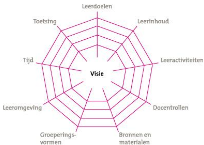
Figuur 1 het curriculaire spinnenweb.

De doelen zoals die omschreven zijn in het leerplanvoorstel vormen de basis voor onderwijsactiviteiten. Het mag duidelijk zijn dat de doelen nastrevenswaardige idealen omvatten die niet te vatten zijn in een aantal lessen, maar die gebaat zijn bij een brede, langdurige aanpak waarbij meerdere facetten van het onderwijs aangesproken kunnen worden. Dit is in lijn met de holistische benadering die kenmerkend is voor mensenrechteneducatie. Het curriculaire spinnenweb van SLO (Akker & Thijs, 2009) biedt een goed model om onderwerpen die de hele schoolorganisatie raken op samenhangende wijze te ordenen. In dit model staat de visie centraal. Het realiseren van die visie is waar het model om draait. Daarbij vormen de draden van het spinnenweb de variabelen die benut kunnen worden om de visie in praktijk te brengen. Bijvoorbeeld het stellen van doelen, het kiezen van leermiddelen, het bepalen van leeractiviteiten, het benutten van de docent als voorbeeld, het samenstellen van groepen leerlingen en dergelijke. Het model is zowel te gebruiken op landelijk niveau als op school en klasniveau. Het onderstaande voorbeeld richt zich op het schoolniveau.