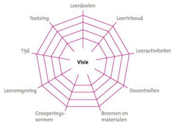
Afbeelding 2 Curriculaire spinnenweb

Het maken van een leerplan vraagt beslissingen over een aantal aspecten. SLO gebruikt voor het leerplan vaak de metafoor van een spinnenweb. Het hart van het curriculaire spinnenweb (Van den Akker, 2003) wordt gevormd door de visie waarop alle andere beslissingen gebaseerd zijn. De draden vormen een web, ze zijn met elkaar verbonden en als je aan één draad trekt, gebeurt er in het hele web iets. Met andere woorden: beslissingen over één aspect hebben gevolgen voor de andere aspecten.