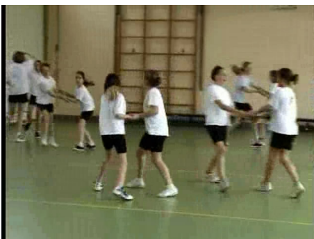
De kinderen voeren een dans uit met zelf bedachte variaties.