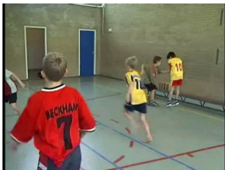
De kinderen spelen een overloopspel met duo-tickers.