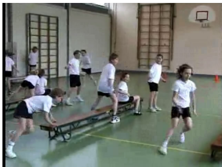
De kinderen doen een estafette met wisselzone.