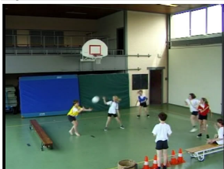
De kinderen spelen opbouwend teambal.