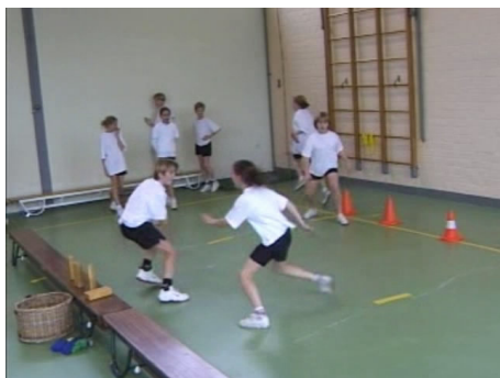
De kinderen spelen een overloopspel.