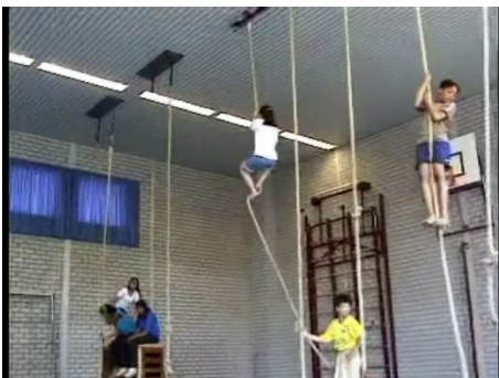
De kinderen klimmen met de klimslag tot bovenin het touw.