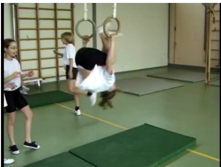
De kinderen duikelen achterover aan de ringen.