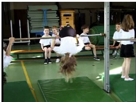
De kinderen duikelen voorover om de duikelstang.