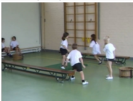
De kinderen spelen een overlooptikspel.