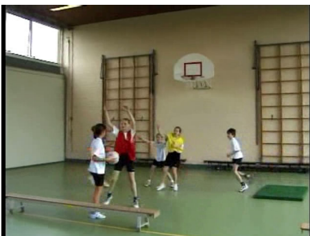
De kinderen spelen dribbeleindvakbal.