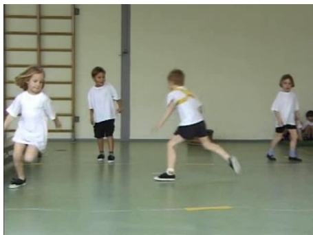
De kinderen spelen 'overlooptje'.