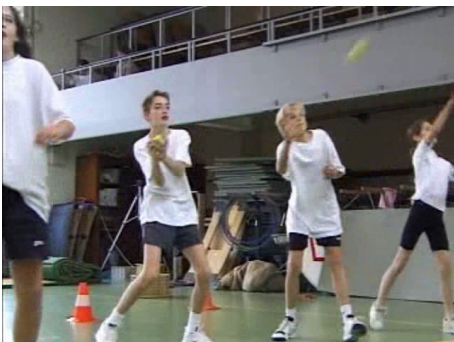
De kinderen kaatsenballen met twee ballen.