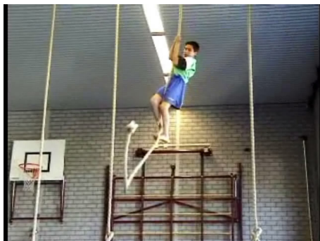
Het kind klimt tot bovenin een zwaaiend touw.