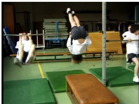
De kinderen duikelen achterover om de duikelstang.