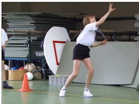
De kinderen werpen en vangen een kleine bal.