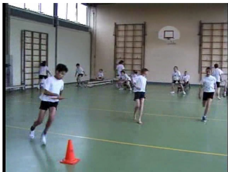
De kinderen houden een estafette met wisselzone en een estafettestokje.