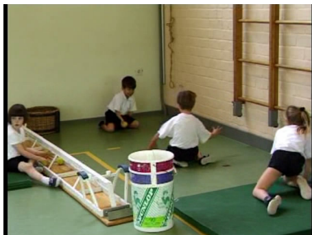
De kinderen spelen een passeerspel.