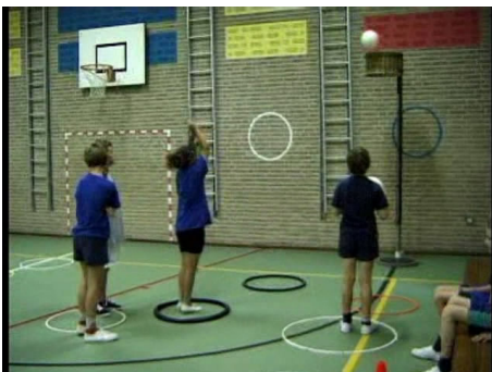
De kinderen mikken van verschillende afstanden in de korf.