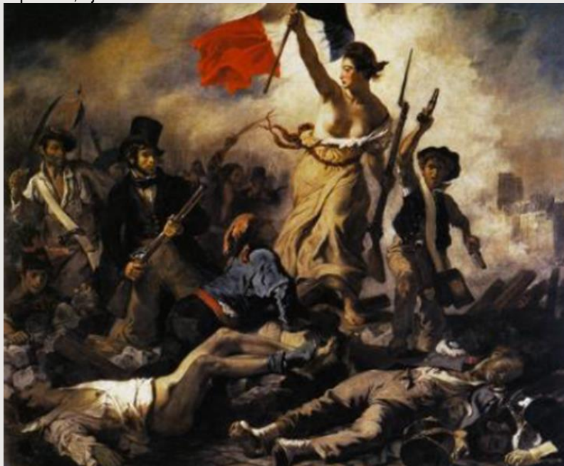
Eugène Delacroix, La Liberté guidant le peuple (De Vrijheid die het volk leidt) , 1830.

In het kunsthistorisch handboek Algemene Kunstgeschiedenis van H. Honour en J. Fleming uit 2009 is een fragment opgenomen over een tekst van de beroemde dichter Heinrich Heine het schilderij van Delacroix Vrijheid die het volk leidt . Heinrich Heine had zich destijds om politieke redenen gevestigd in Parijs. Volgens Heine baarde Vrijheid die het volk leidt veel opzien omdat het werd beheerst door 'een grote gedachte', in dit geval een politieke gedachte. Om deze reden sluit het aan bij de context politiek, tijdvak 1750-1900.