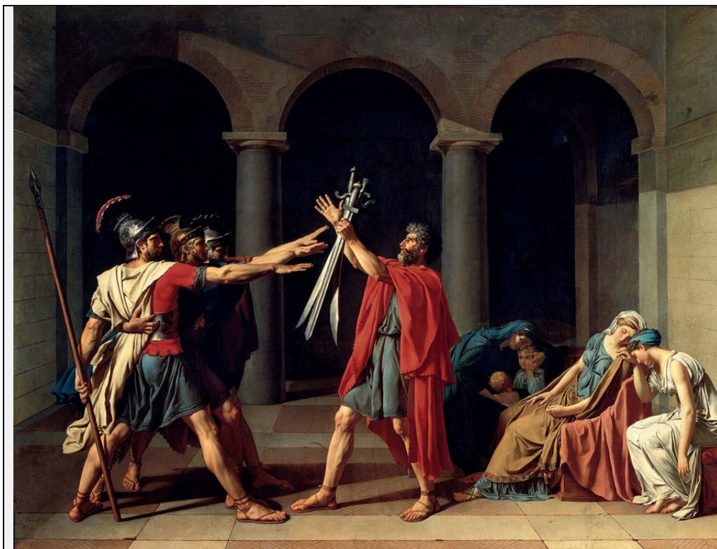
Afbeelding 1. J.L. David, De eed van de Horatiërs , 1784.

In de eerste periode van 6 vwo krijgen leerlingen op het Herman Wesselink College in Amsterdam in de les beeldende vakken (tehatex) de volgende vraag voorgelegd bij een afbeelding van het schilderij van J.L. David, De eed van de Horatiërs (1784).