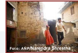
Huizen zijn beschadigd

5 Eind april beefde de aarde in het Aziatische land Nepal. En op 12 en 16 mei waren er opnieuw aardbevingen. Meer dan 8000 mensen verloren daarbij het leven. En duizenden mensen raakten gewond. Ook zijn er honderdduizenden gebouwen verwoest of beschadigd. De ravage is groot. Vanuit de hele wereld is er nu hulp voor het land. Ook vanuit Nederland.