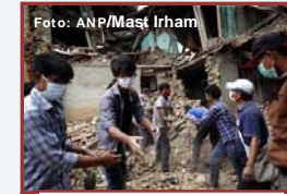
Mensen ruimen het puin op

Eind april begon de aarde in Nepal plots te beven. Vooral in en rond Kathmandu. De beving had een kracht van bijna 8. Dat is een zware aardbeving. Huizen en gebouwen stortten in. Mensen raakten bedolven onder het puin. Of ze raakten gewond door rondvliegend glas. Er 20 brak paniek uit. Bewoners vluchtten hun huizen uit en probeerden weg te komen. Ook de elektriciteit viel uit. Op de Mount Everest ontstonden lawines. Klimmers raakten er bedolven onder sneeuw, ijs en rotsen. Op 12 mei vond een tweede beving plaats. Die had een kracht van iets meer dan 7. En er was nog een derde beving. Die was op 16 mei en had een kracht van bijna 6. 25