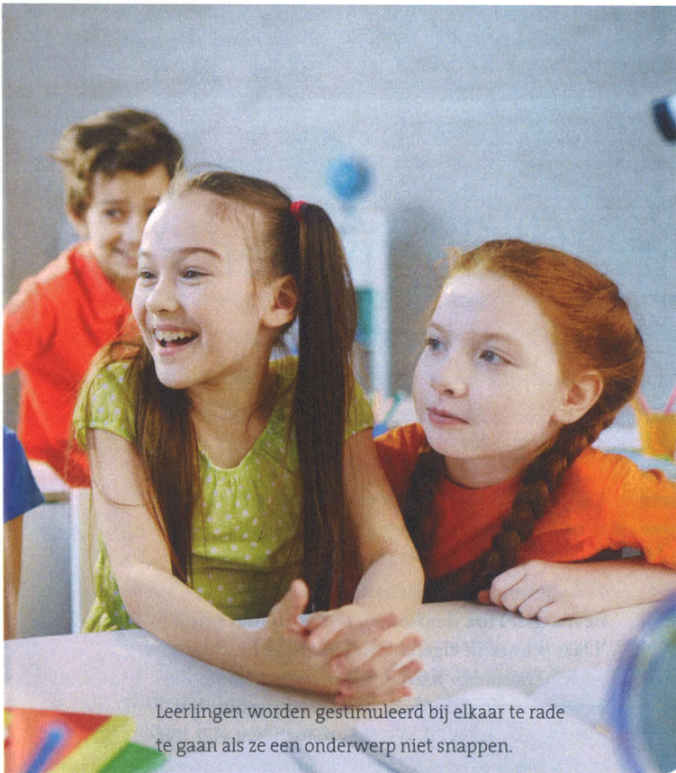
Leerlingen worden gestimuleerd bij elkaar te rade te gaan als ze een onderwerp niet snappen.